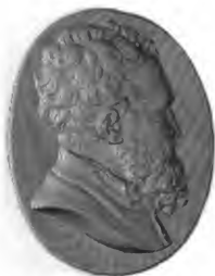
MICHEL ANGE BUONAROTTI.